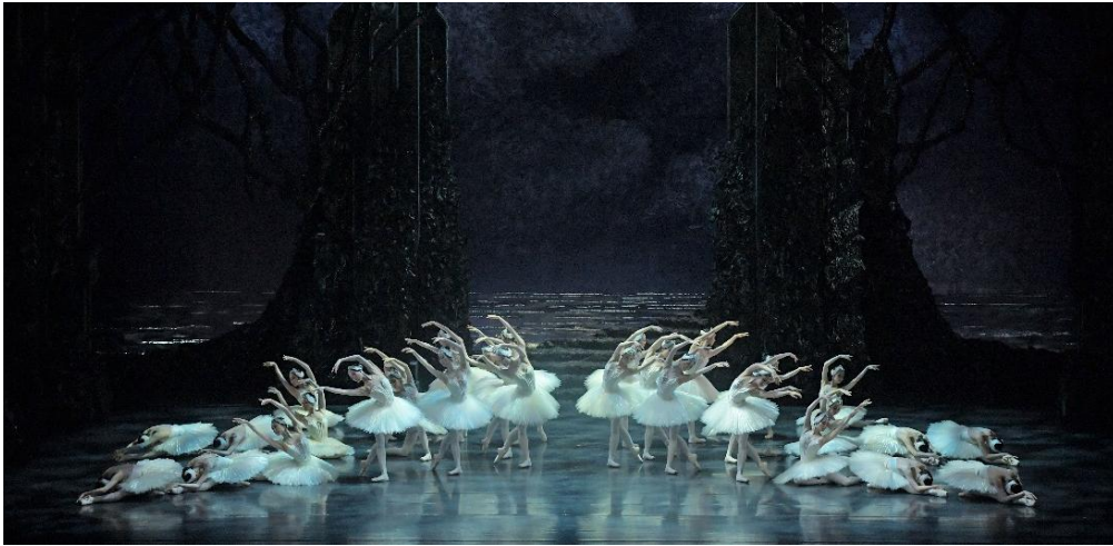
2021年公演より

その他、4幕のそれぞれが意思をもった白鳥たちのドラマティックな群舞や衝撃的なラストなど、ライト版の見どころは枚挙に暇がありません。厚みのあるストーリー展開をどうぞお楽しみください。