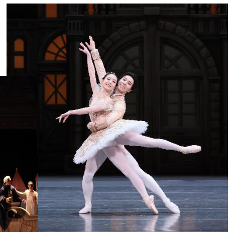
2023年公演より