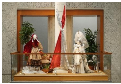
演劇『INTO THE WOODS』より 赤ずきんちゃん／シンデレラ