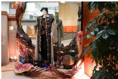
オペラ『さまよえるオランダ人』 オランダ人