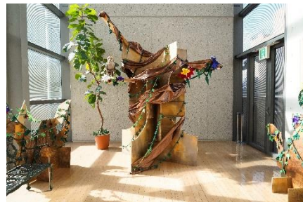
左「願いの木 Wishing Tree」 右「オリジナルバレエチュチュ」

このプロジェクトでは、前回の展示で使われたストレッチ生地のお花の装飾を分解し、参加者の皆様に再構築していただきます。新たに大木として生まれ変わり、空間を彩るオブジェとなります。詳細は後日ウェブサイトにてお知らせいたします。