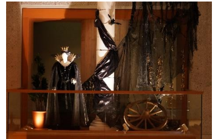
バレエ『眠れる森の美女』 カラボス