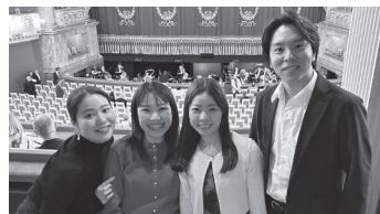
「ANAスカラシップ」については、新国立劇場オペラ研修所ウェブサイトをご覧ください。