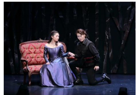
試演会「2つのロメオとジュリエット」

出演者・スタッフへの取材や公演情報紹介の機会を頂けますよう、 よろしく願いいたします。