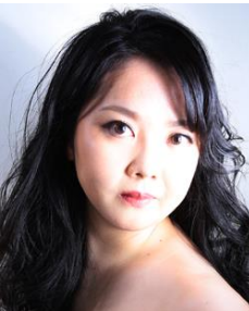
一條翠葉 (メゾソプラノ)