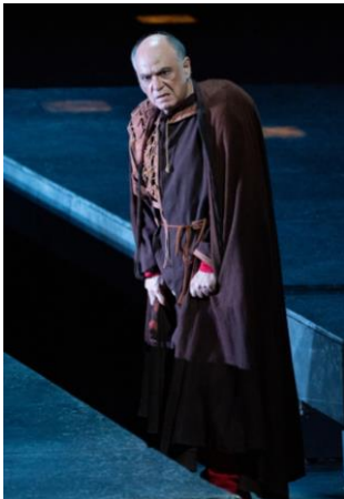
『リゴレット』(2023年5月)より

本プロダクションはフィンランド国立歌劇場及びテアトロ・レアルとの共同制作で、新国立劇場での世界初演後にヘルシンキ、マドリードでの上演が予定されています。