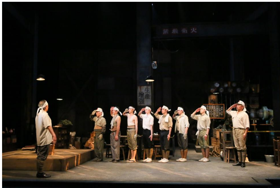
2020年4月舞台稽古風景