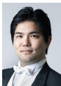
伊良波良真 (バリトン)