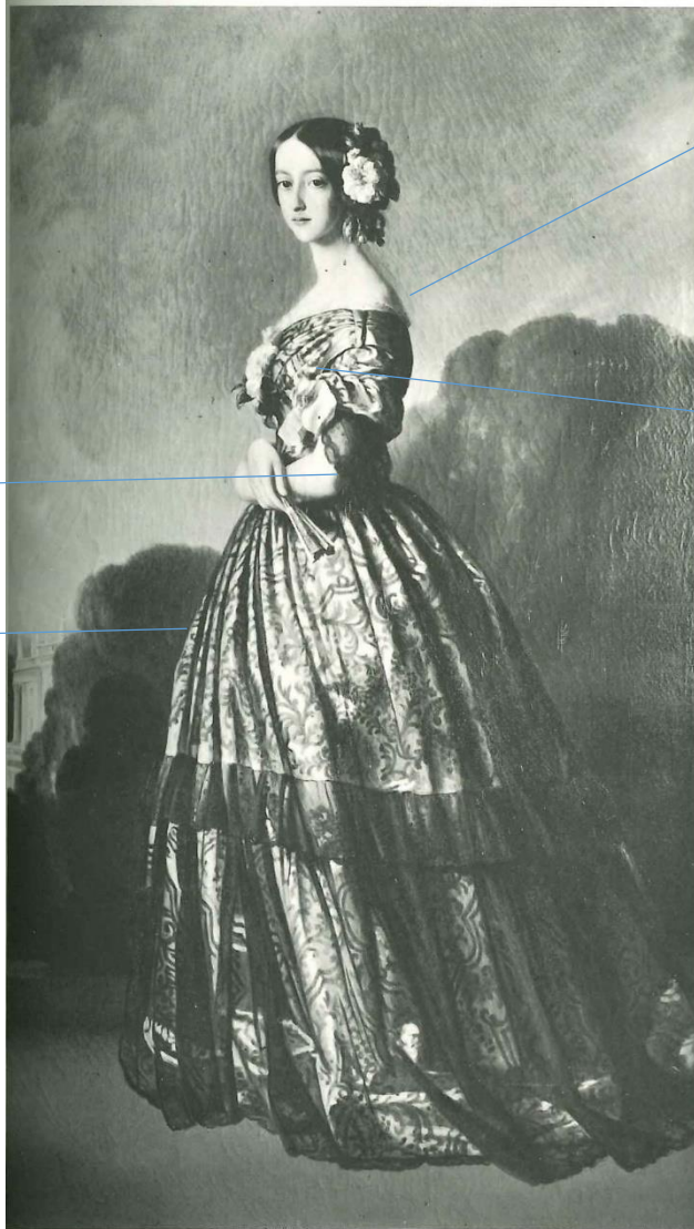
923 WINTERHALTER: Princesse de Joinville , 1844 Versailles, Museum.

時代が進むにつれ、スカートは釣鐘型（ベル型）からドーム型になり、その円はますます大きくなっていく。1854年ごろ登場したクリノリンはスカートに張りをもたせる技術として一世を風靡した。