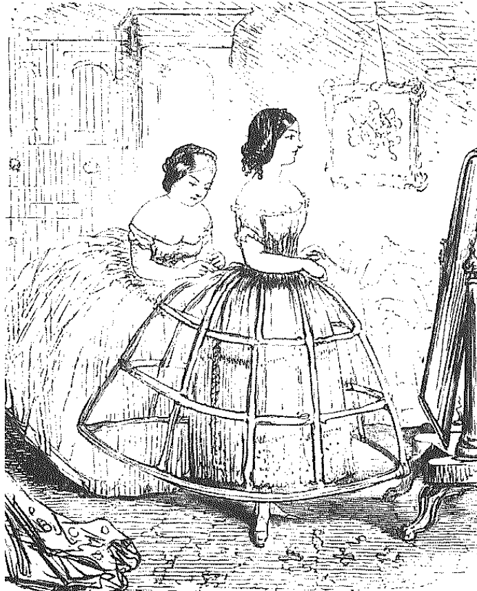
「ひとりで着られないとはやっかいね」

クリノリンは1854年～67年頃のモード。 1830～40年ごろはスカートをふくらませるためにジュポン（ペティコート）やス・ジュープ（アンダー・スカート）が使用されていましたが、クリノリンはそれに張りをもたせるための繊維素材として登場しました。