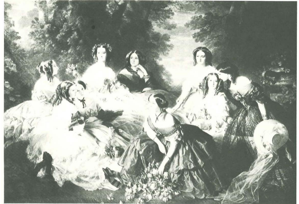
「ウジェニ皇后と女官たち」 初期のウォースの衣装を着ている 1860年 ウィンテルハルター画

クリノリンは次第に金属のタガが用いられるようになります。 フランス・モード産業の近代化の推進者である、イギリスのシャルル・フレデリック・ウォース（1825～95）は、この金属製のクリノリンをいち早く採用し、優雅なドレスを世に送りだしました。